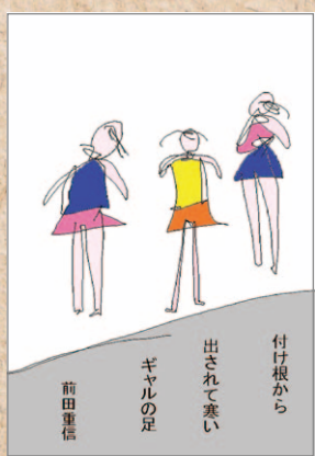
付け根から 出されて寒い ギャルの足 前田 重信