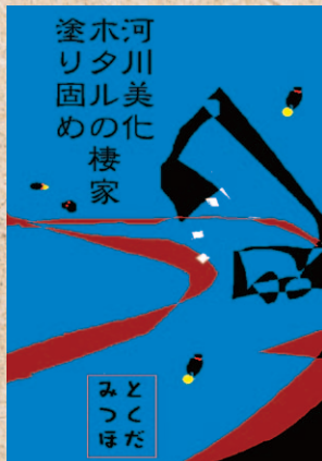
とくだみつほ (八幡浜市)

放射能防護の水着流行か 海水の汚染は、原発から一定の範囲内の海水浴を禁止することになるかも。しかし、この格好で街を歩くのも悪くはない。個人的には、女性にオススメしたい。