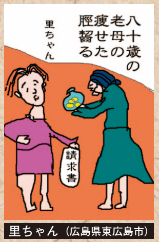
里ちゃん (広島県東広島市)

節電のペビーブームがやってくる 「人口学」研究者の大方の見かたである。経済の地盤沈下は就業者の減少。ひいては生活保護世帯の増加となり、「貧乏人の子沢山時代」の再来で少子化問題は一挙解決。メデタシメデタシ。