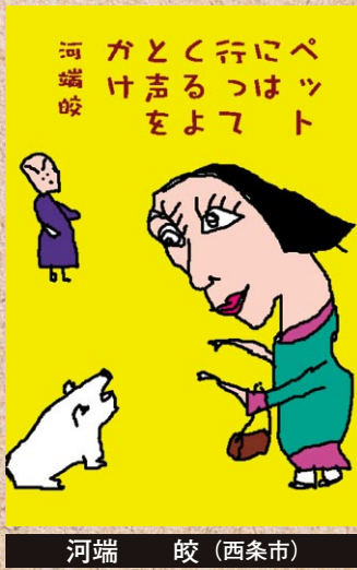
河端 皎 (西条市)