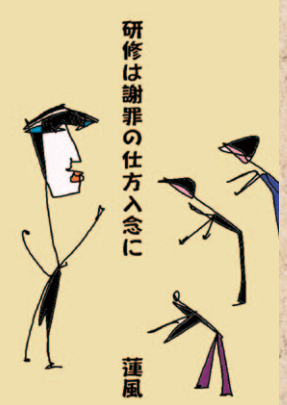
研修は謝罪の仕方入念に 蓮風

研修は謝罪の仕方入念に デパートでは毎日、研修してるらしい。お わびで頭をさげると「禿げ」が見える。あ れで同情を誘うらしい。だから脱毛剤が売 れる。