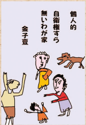
個人的 自衛権すら 無いわが家 金子宣

個人的自衛権すら無いわが家 父権は失われ、買い物のお手として スーパーへ行く程度の活躍。駐車場では エアコン止めて我慢しなさい。もったい ないから。