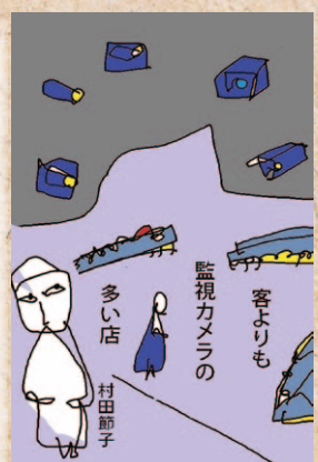
客よりも監視カメラの多い店 村田 節子

川柳をつくるロボット開発へ 良いアイデアですが、世の中の川柳はアクリート川柳ほど面白くない。アクリートのレベルを目指してください。花山さんがロボットの扮装するのがええ。 花山 昇（松山市）