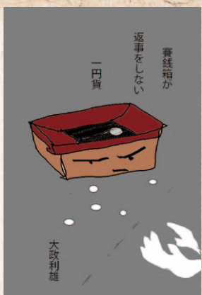
賽銭箱が返事をしない一円貨 返事をしない 一円貨 大政利雄

賽銭箱が返事をしない一円貨 賽銭箱が返事をしないのではなく、そんなふうにも思っただけでしょう。一万円札を入れても音がしません。どうせ音がないのだから、一円貨の方が安上がり。 大政 利雄（松前町）