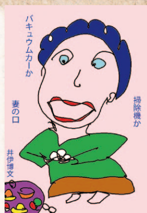
掃除機かバキュームカーか妻の口 掃除機か バキュームカーか 妻の口 井伊博文

賽銭箱が返事をしない一円貨 賽銭箱が返事をしないのではなく、そんなふうにも思っただけでしょう。一万円札を入れても音がしません。どうせ音がないのだから、一円貨の方が安上がり。 大政 利雄（松前町）