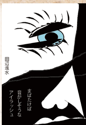
まばたけば音かしてさうなアイラッシュ まばたけば 音かしてさうな アイラッシュ 田辺進水

飲む水に飲まれる怖さ超豪雨 水は、足りなくても余っても困るもの代表だろうね。「日頃、飲まれてばかりだから飲み返してやろう」という水の気持ちを持ち提えたところが非凡である。 石原 康正（松山市）